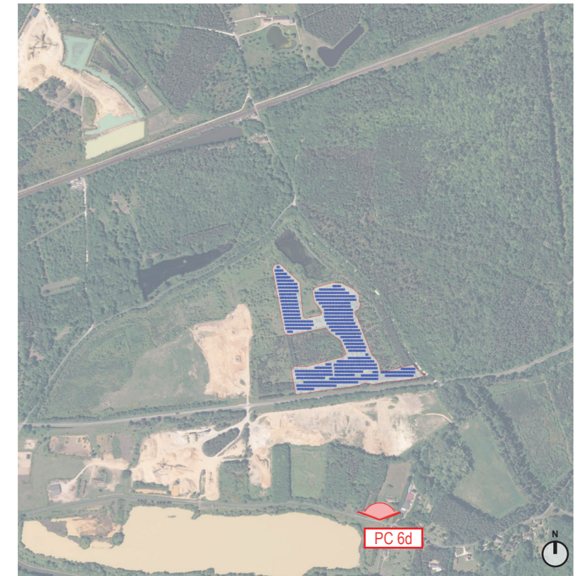
PLAN DE REPÉRAGE DE LA VUE