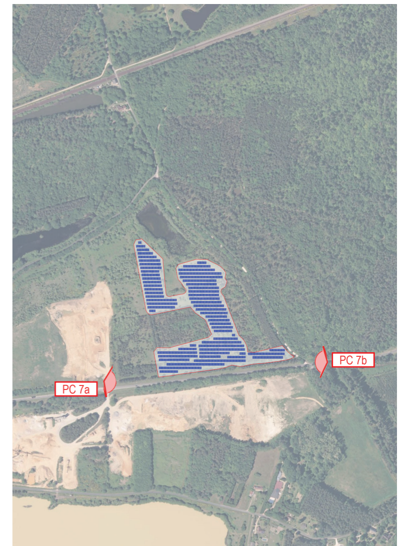
PLAN DE REPÉRAGE DES VUES